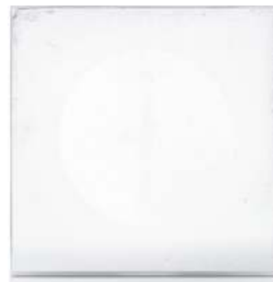
(A) CLARVISTA GEHÄRTETES DUSCHGLAS Haze nach dem Test < 1 %

Normales unbeschichtetes Glas und auch das führende beschichtete Duschkabine ist anfällig für Korrosion. Diese Korrosion kann Ihre Duschkabine mit der Zeit „stumpf“ aussehen lassen. Die echte Schönheit der widerstandsfähigen, glatten Oberfläche von Clarvista wird deutlich durch ihre Fähigkeit, den korrosiven Einflüssen von Nässe, Luftfeuchtigkeit und den chemischen Zusätzen der üblichen Haushaltsreiniger zu widerstehen. Das hat sich im Versuchslabor gezeigt, und das wird sich auch bei Ihrer Dusche zeigen. Bei sorgfältiger und regelmäßiger Pflege wird Ihre Dusche länger wie neu aussehen. Und das ist ein guter Grund, sich für Clarvista Glas zu entscheiden.