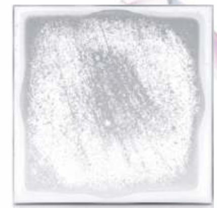
(C) GEHÄRTETES UNBESCHICHTETES DUSCHKLARGLAS Haze nach dem Test 77 %

Hinweis: Haze ist ein wissenschaftlicher Maßstab für die Durchsichtigkeit von Glas. Je kleiner die Haze-Maßeinheit, desto klarer erscheint das Glas.